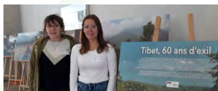
Exhibit on Tibet, by Les Amis du Tibet from 30.09.22 till 07.10.2022.

Exposition sur Le Tibet par les Amis du Tibet du 30.09.2022 au 07.10.2022.