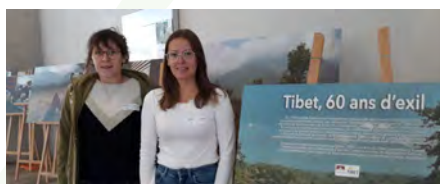
Exhibit on Tibet, by Les Amis du Tibet from 30.09.22 till 07.10.2022.

Exposition sur Le Tibet par les Amis du Tibet du 30.09.2022 au 07.10.2022.